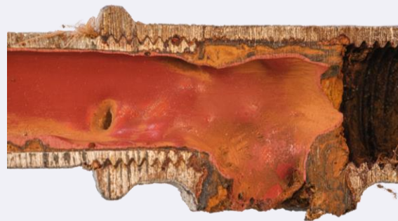
Abbildung 3: Beispielhafte Darstellung eines Formteiles mit einer unzureichenden Innenbeschichtung

beeinträchtigen, müssten diese ausgebaut und durch Passstücke überbrückt werden. Nach Aushärtung des Beschichtungsmaterials würde jedoch gleichzeitig mit dem Entfernen der Passstücke zwangsläufig die Beschichtungsoberfläche wieder beschädigt bzw. aufgebrochen werden.