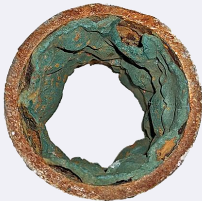
Abbildung 5: Beispiel einer unzureichenden Innenbeschichtung in einer Trinkwasser-Leitung (Quelle: https://www.ua-bw.de/pub/beitrag.asp?subid=0&Thema_ID=2&ID=3817&Pdf=No&lang=DE )

Insbesondere bei einer Blasenbildung oder Ablösung der Beschichtung ist unter der Beschichtung zudem eine verstärkte mikrobiologische Kontamination denkbar, da hier keinerlei Wasseraustausch stattfinden kann. Durch reduzierte Sauerstoffzufuhr, Stagnation und ideale Temperaturen kann in diesen Bereichen das Wachstum von Mikroorganismen wie coliformen Keimen oder Pseudomonas aeruginosa begünstigt werden, die sich unter normalen Bedingungen im Trinkwasser nicht vermehren würden.