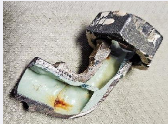
Abbildung 6: Beispiel Vollfüllung einer Rohrleitung mit Beschichtungsmittel an Winkel-Formteil

Vergangenheit bereits mehrfach in der einschlägigen Fachpresse berichtet, was zu Querschnittsverengungen bis hin zum Verschluss der Leitungen geführt hat 2 .