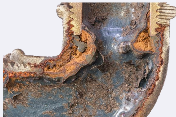
Abbildung 4: Beispielhafte Darstellung eines unterkrochenen Verbindungsteiles

Auch an diesen Grenzflächen können Haarrisse entstehen, an welchen aufgrund Kapillarwirkung das Wasser die Beschichtungsoberfläche unterkriechen kann. Zwischen der Rohroberfläche und der Beschichtung kann sich im Laufe der Zeit ein hervorragend geschütztes Milieu für Biofilm und Bakterien bilden. Gleiches gilt, falls zu einem späteren Zeitpunkt Teilbereiche einer Sanitärinstallation (z.B. ein Badezimmer in einem Mehrfamilienhaus) baulich ausgetauscht werden sollen.